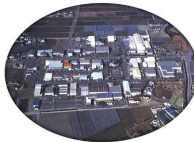
協同組合徳島総合流通センター 航空写真 (1984年3月 団地竣工時)