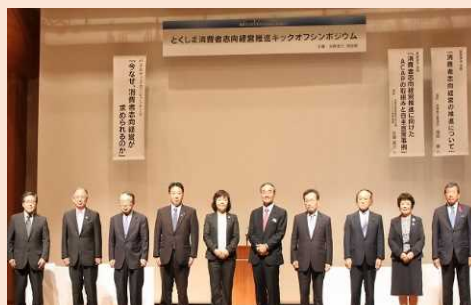
とくしま消費者志向経営推進組織設立(平成29年10月13日)