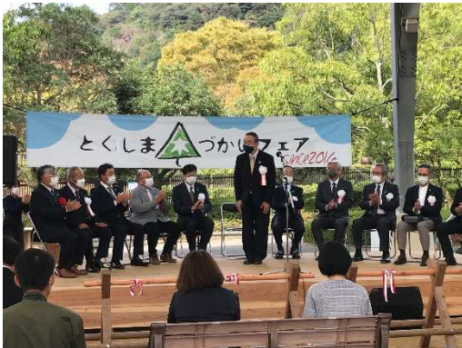
「木づかいフェア 2022」オープニング

また Instagram をはじめとする SNS や徳島県木材協同組合連合会の youtube チャンネルを開設し情報発信することで、木の魅力や県産材の利用促進 PR を行っています。