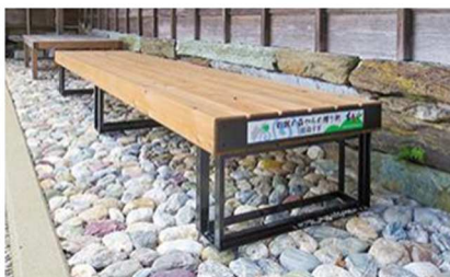
徳島県 第十二番札所 摩盧山 正寿院 焼山寺

四国遍路八十八ヶ所霊場に木製ベンチを作製・設置しました。この活動は四国四県の木連である「徳島県木材協同組合連合会」「香川県木材協会」「愛媛県木材協会」「高知県木材協会」の合同で行われ、2017年8月1日に第七十四番札所「医王山多宝院甲山寺」にて木製ベンチ設置式が執り行われました。四国の県木連が共同で企画した初の試みはメディアの注目を集めました。