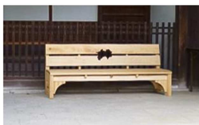
愛媛県 第五十番札所 東山 瑠璃光院 繁多寺