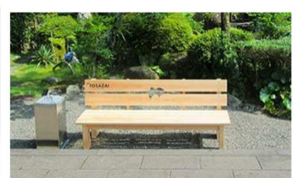
高知県 第三十九番札所 赤亀山 寺山院 延光寺