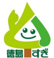
徳島すぎロゴマーク

また平成3年度には、明石海峡大橋の開通をにらんで策定された、3000日島戦略「県産木材住宅供給システム」基本構想に基づき、当連合会の組合員との調整を図り、産学官のシステム開発支援を行ってきました。そして平成18年には、当連合会と徳島県森林組合連合会及び学識経験者で組織する「徳島県木材認証機構」を発足させ、「産地認証」や違法伐採対策としての「合法性の証明」のための制度を確立し、県産材のブランド化図ってきました。